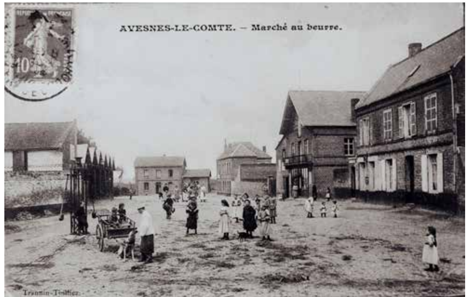
Marché au beurre

Au programme : visite guidée de l'Eglise, parcours commenté sur le patrimoine historique et inauguration d'un parcours permanent de découverte de l'histoire de la commune. Le détail de ces journées sera diffusé début Septembre. Réservez votre week-end !!